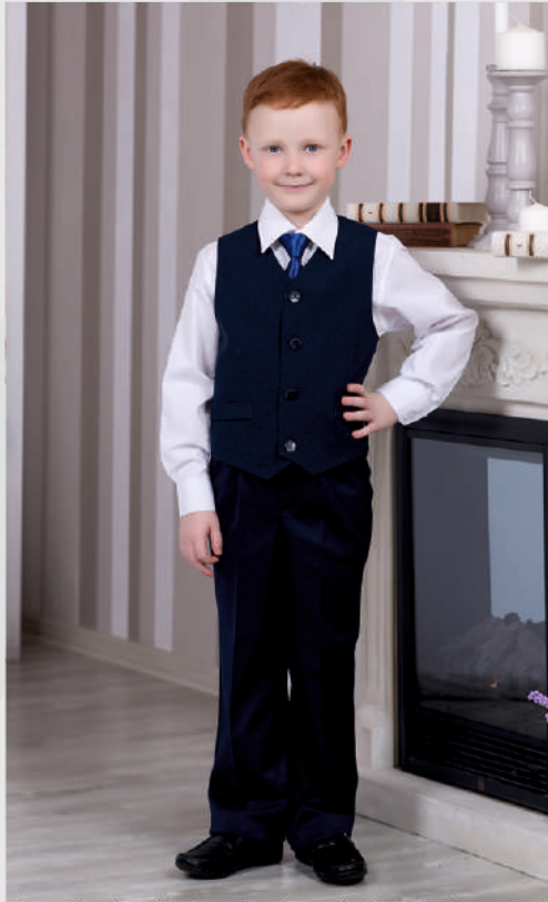
Костюм «Ученик №5»