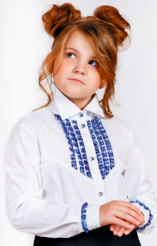
«Барбара» синяя тесьма