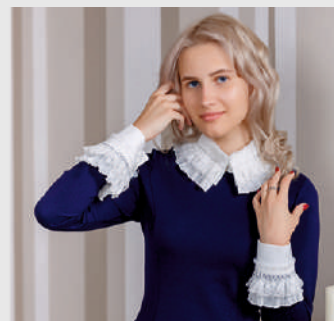
Воротник + манжеты «Вальс»