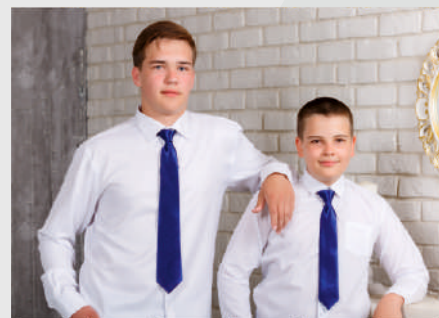
Галстуки в ассортименте