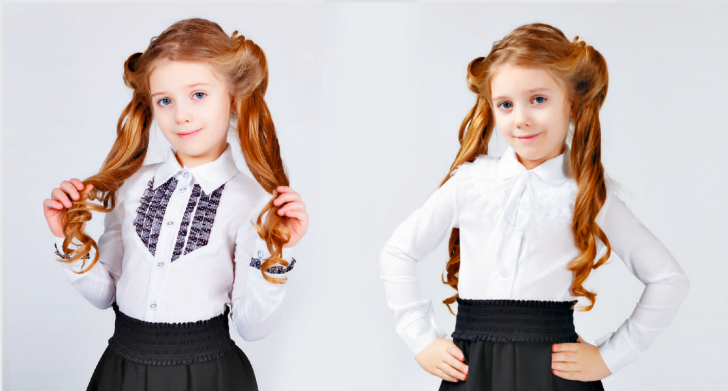
«Барбара» черная тесьма