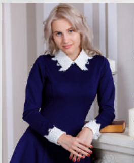
Воротник + манжеты «Ретро»