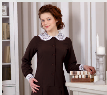
Воротник + манжеты «Яна»