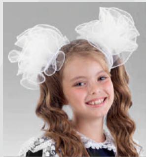
Банты в ассортименте